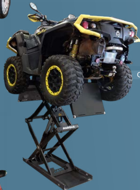
Quads et SSV ATVs and SSVs