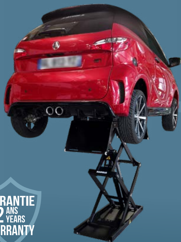
Voiturettes License-free cars