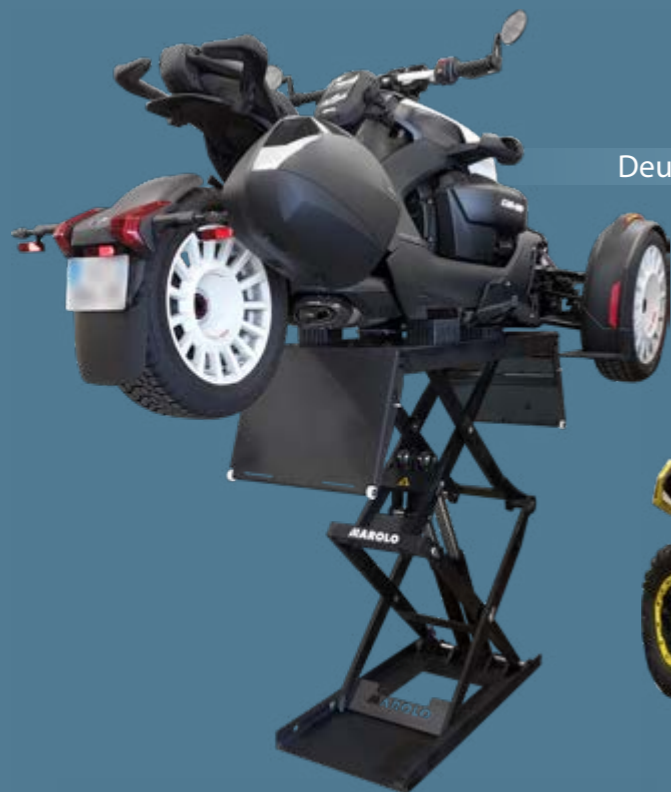
Deux-roues et Trikes 2-wheelers and trikes